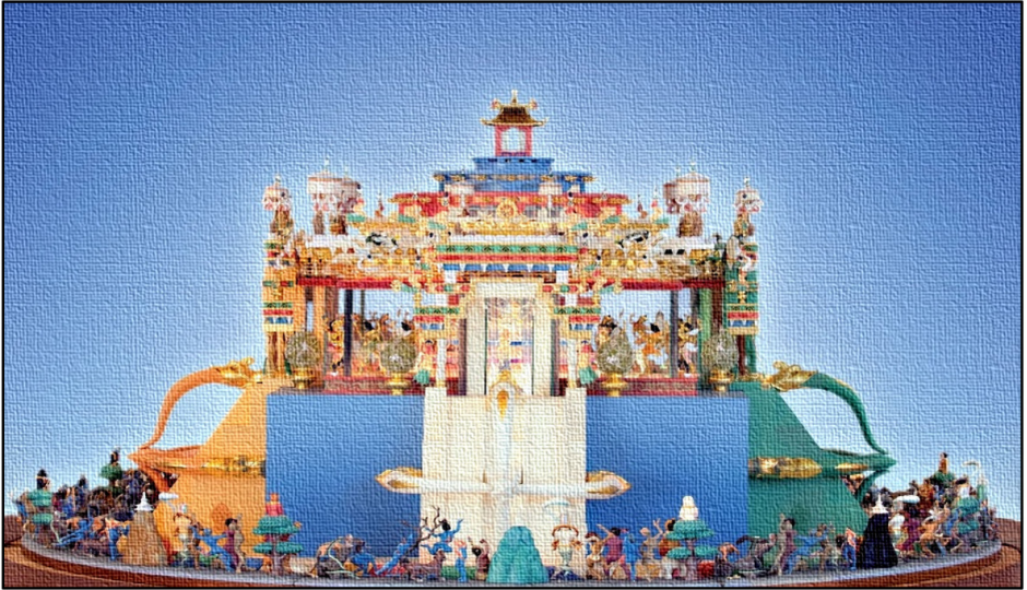
Figura 4 – Representação artística mandala tridimensional de Buda Heruka.