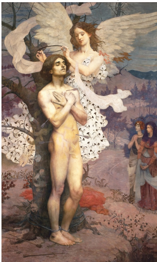
Figura 1 - Recompensa de São Sebastião. Eliseu d'Angelo Visconti, 1898. Óleo s/tela, 218 x 133 cm. Museu Nacional de Belas Artes, Rio de Janeiro.