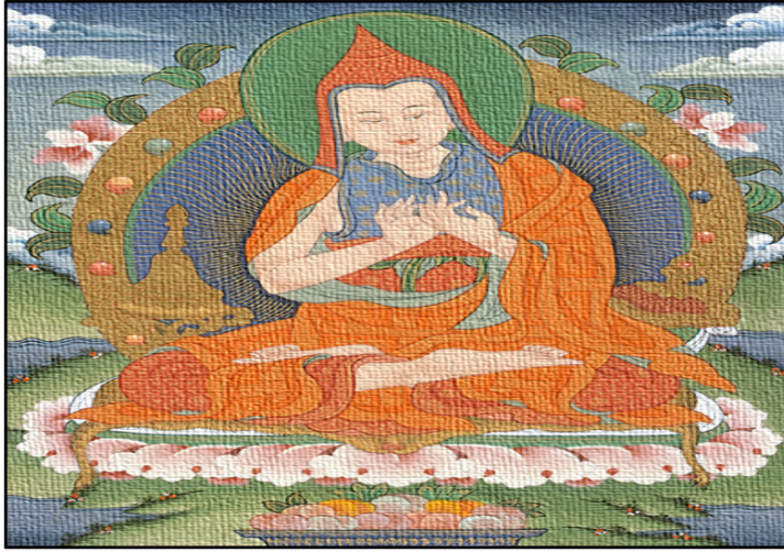
Figura 1 – Representação artística do Mestre indiano Atisha.