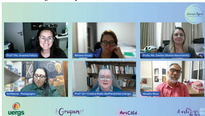
Figura 9 – Captura de tela dos bastidores do dia 4

Ao final da transmissão, o chat transformou-se em uma onda de aplausos virtuais. Foram dezenas de mensagens de agradecimento e emoção. Observando a tela, senti o cansaço misturado à alegria serena de quem vê o trabalho alcançar o coração das pessoas. O vídeo dessa noite chegou a 369 visualizações e foi um dos mais comentados de toda a semana. Mesmo dias depois, as interações continuavam crescendo, com pessoas compartilhando o link e marcando outras mulheres para assistir. É inspirador ver como um evento assim ultrapassa o instante da transmissão e continua ecoando, mantendo o folclore vivo como um diálogo em constante movimento.