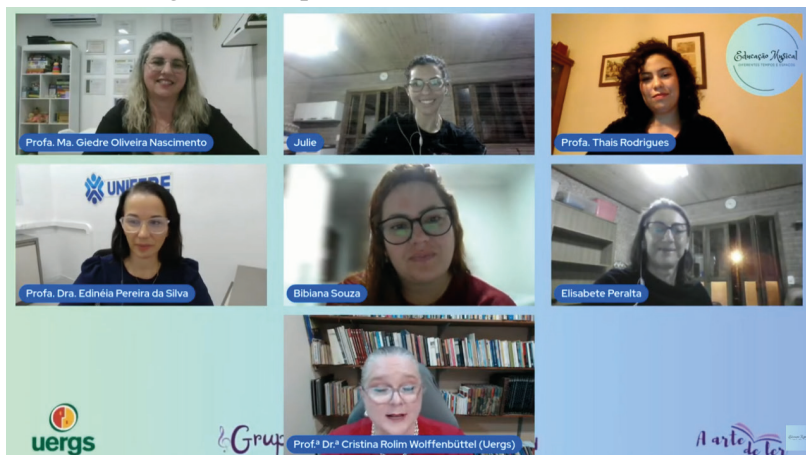
Figura 11 – Captura de tela dos bastidores do dia 5