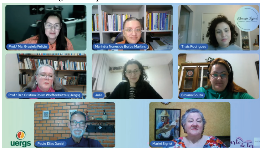
Figura 3 – Captura de tela dos bastidores do dia 1

A gravação dessa primeira noite alcançou 458 visualizações, número que segue crescendo. O YouTube se tornou um arquivo vivo dessas experiências, permitindo que novas pessoas acessem o conteúdo, conheçam as reflexões e se emocionem com os mesmos versos. Cada visualização é um eco do vivido, uma extensão do evento no tempo e no espaço digital, prova de que o folclore também encontra morada nas telas e nas redes.