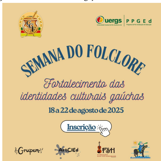
Figura 1 - Card usado na divulgação com o link de Inscrição

A seguir, relato um pouco do que vivi em cada uma das noites da Semana do Folclore 2025, com o olhar de quem esteve por trás das câmeras, acompanhando, aprendendo e sentindo o evento em sua essência.