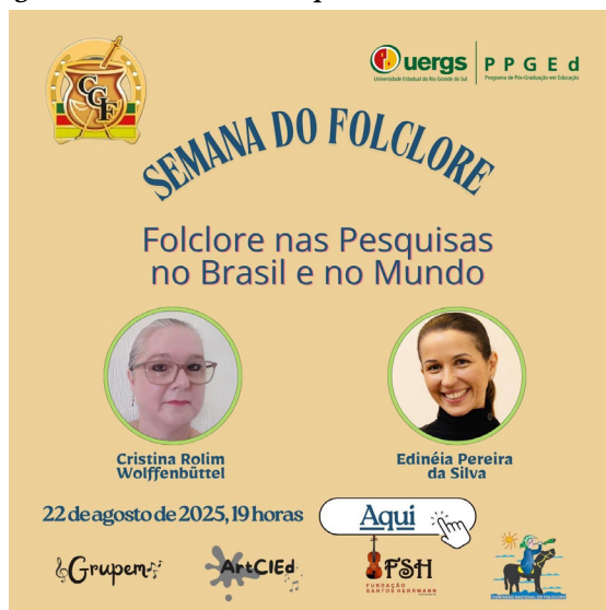
Figura 10 - Folclore nas Pesquisas no Brasil e no Mundo