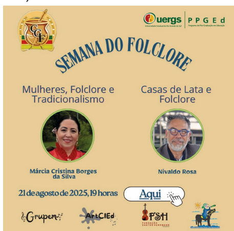
Figura 8 - Mulheres, Folclore e Tradicionalismo / Casas de Lata e Folclore