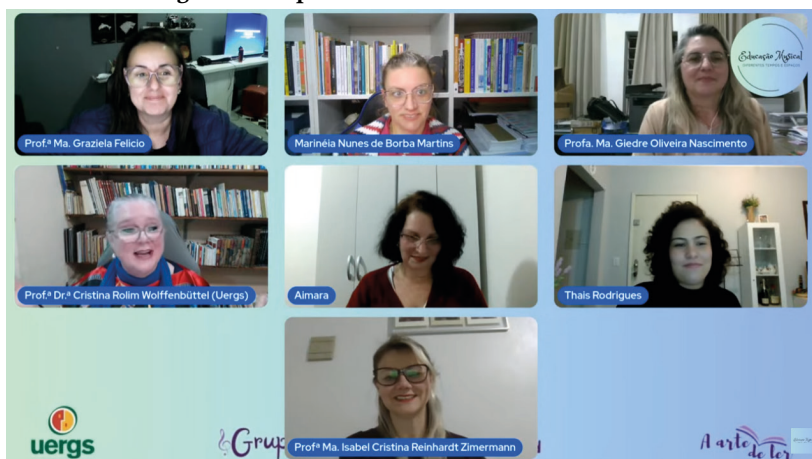
Figura 5 – Captura de tela dos bastidores do dia 2

Ver esse movimento é profundamente gratificante. A Semana do Folclore não termina quando a transmissão se encerra; ela permanece viva em cada educador que leva o tema para sua sala de aula, em cada aluno que descobre que o folclore faz parte de quem ele é. E para nós, que atuamos por trás das câmeras, essa é a maior recompensa: saber que o que ajudamos a construir continua tocando pessoas muito além daquele instante ao vivo.